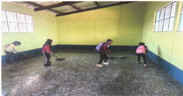
Foto 5: Limpieza de piso de granito en las aulas del proyecto finalizado.