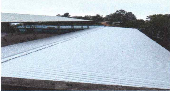
Foto1: Se finalizo el cambio de techo de lámina galvanizado por lámina troquelada