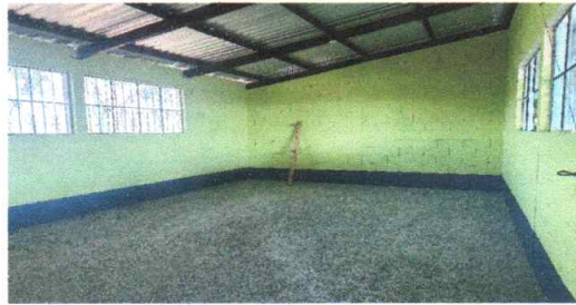
Foto 3: Se finaliza la pintada interior de las aulas remodeladas.