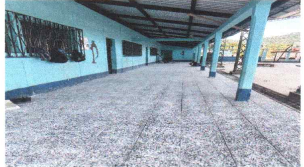
Foto 2: Finalización de cambio de piso rústico por piso de granito exitosamente en el módulo de 4 aulas, dirección y corredor